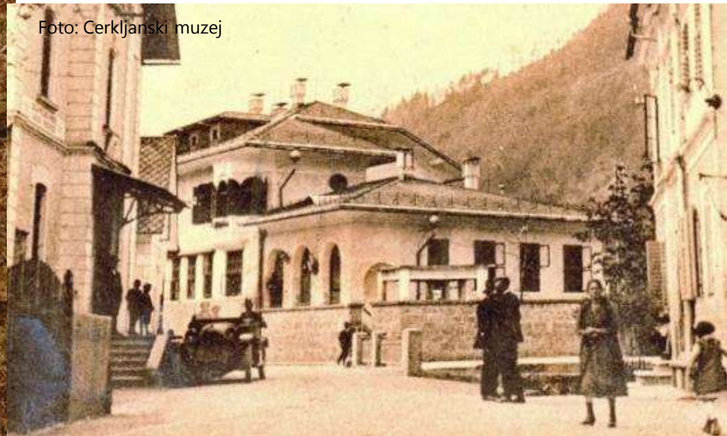
Današnje muzejsko poslopje v prvotni podobi, okoli leta 1930