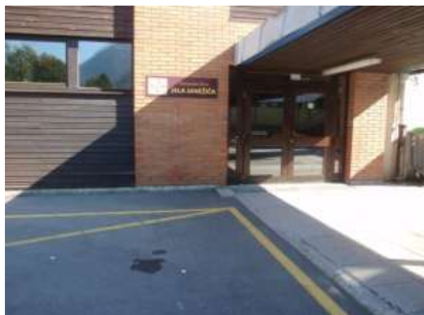
SLIKA 1 GLAVNI VHOD ŠOLE

Dostop do glavnega vhoda je urejen po pločniku, ki poteka ob OŠ Ivana Groharja. Vozišče je označeno z rumeno črto. Tik ob vhodu je označeno mesto za intervencijska vozila in je prepovedano puščanje vozil.