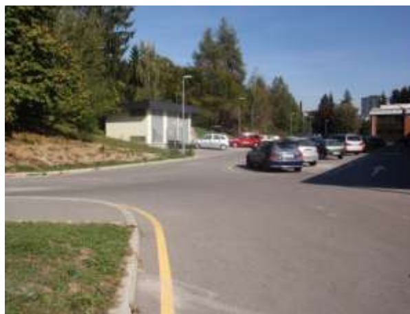
SLIKA 3 PREČKANJE DOVOZNE CESTE BREZ PREHODA ZA PEŠCE.

Na tem mestu ni označenega prehoda za pešce. Učenci nadaljujejo pot po pločniku.