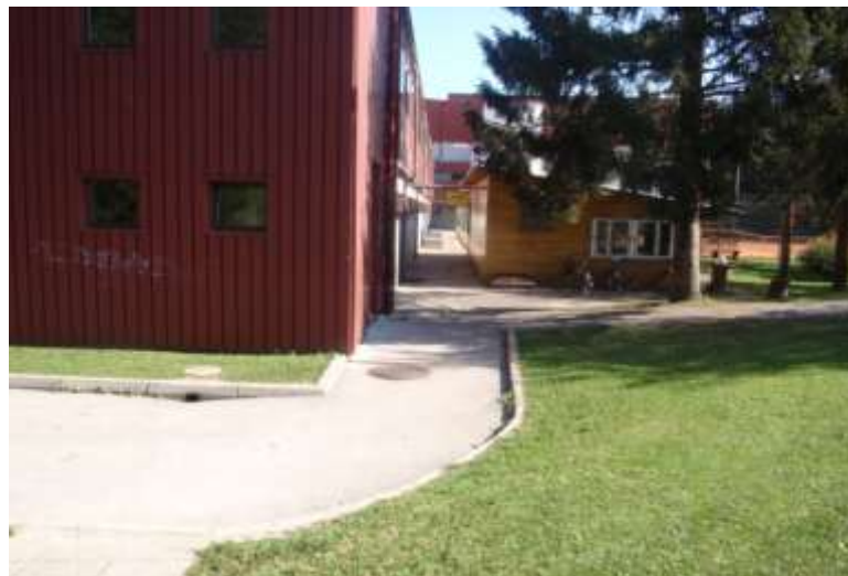
SLIKA 13 POT DO JEDILNICE V ŠC OB ŠPORTNI DVORANI

Prav tako je urejeno za pešce, ki gredo v smeri glavne avtobusne postaje oz. v staro mestno jedro, knjižnico, Namo ali pa v zdravstveni dom.