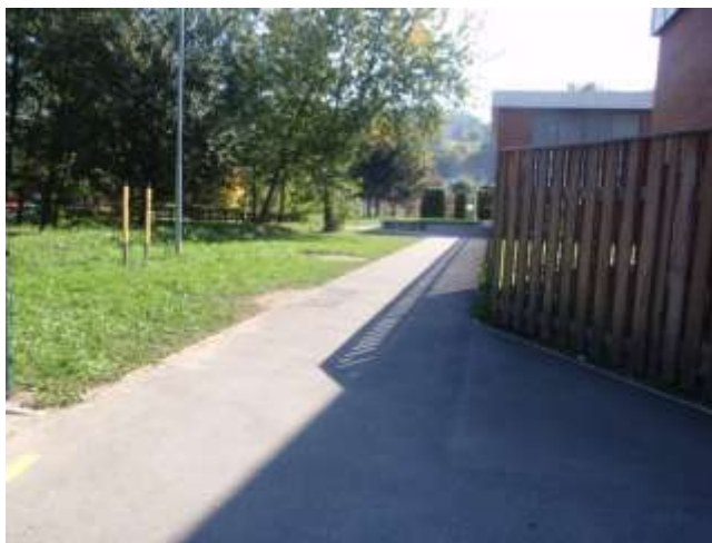
SLIKA 12 POVRŠINA NAMENJENA PEŠCEM

Učenci imajo lepo urejeno pot do jedilnice v Šolskem centru. Pot je namenjena peščem.