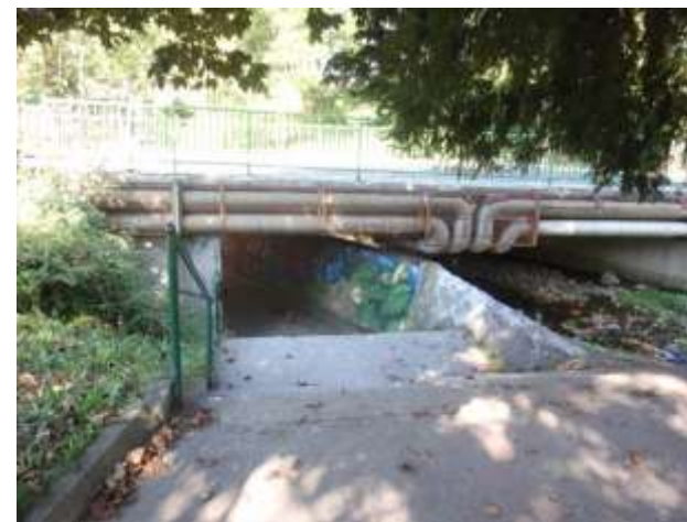
SLIKA 9 VSTOP V PODHOD