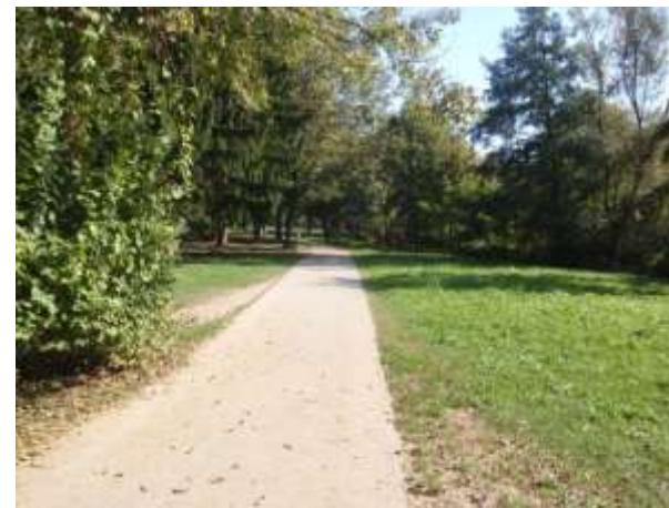
SLIKA 14,15 POT NAMENJENA PEŠCEM IN KOLESARJEM JE SKUPNA