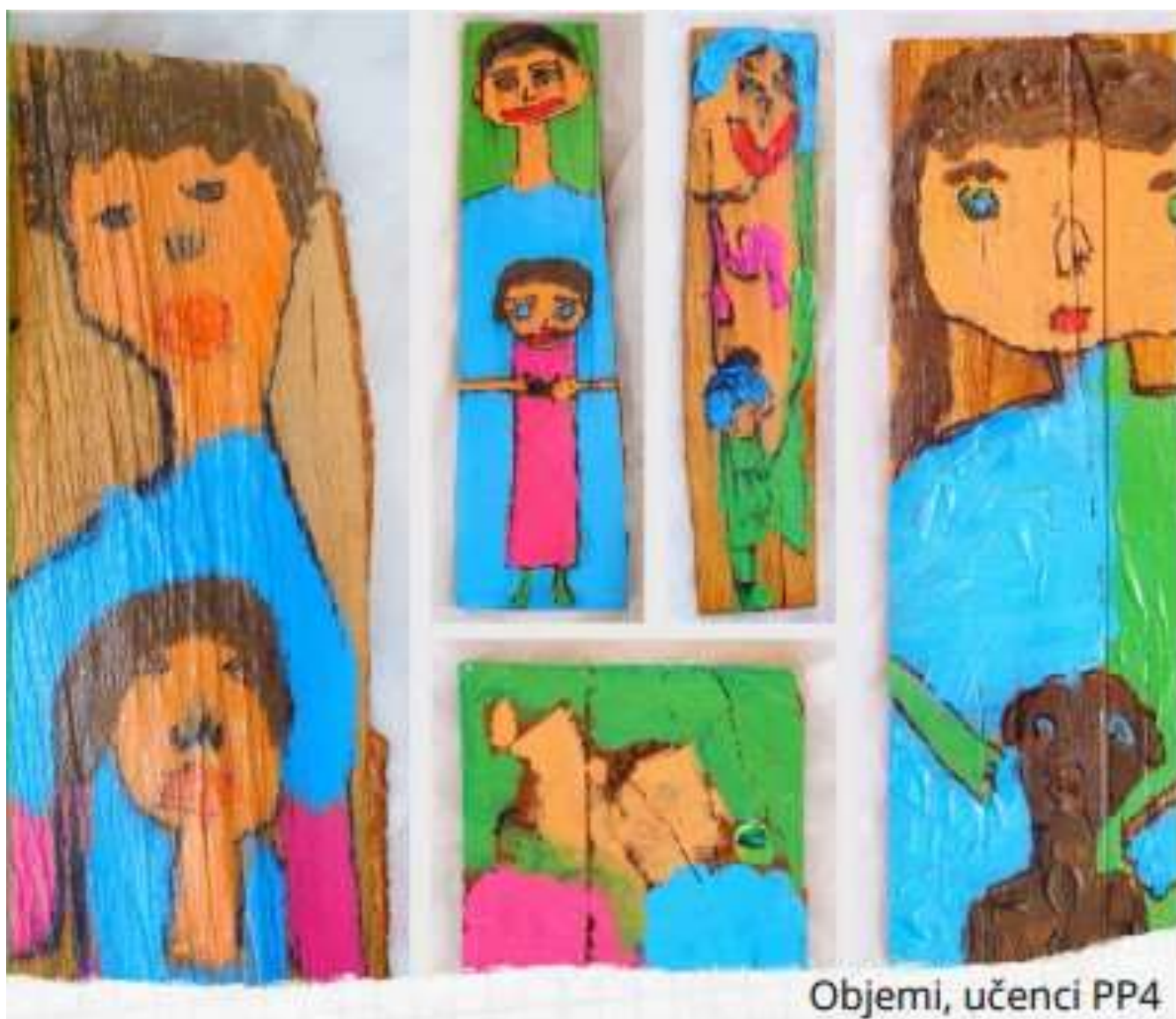
Objemi, učenci PP4